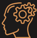
Psychologie Index 110