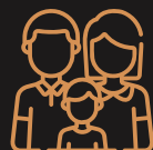
Opvoeden van kinderen Index 112