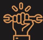
Zelf aan de auto / motor / brommer sleutelen Index 112