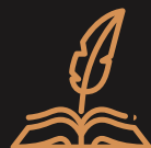
Geschiedenis Index 112