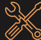
Klussen / doe-het-zelf Index 115