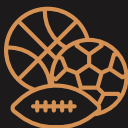
Sport Index 108