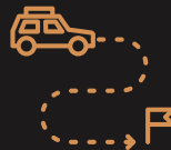
Met de auto eropuit Index 110